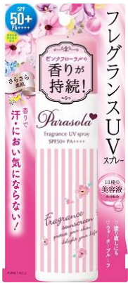
旧品： パラソーラ フレグランス UV スプレー

尚、「パラソーラ フレグランス UV スプレー N」の発売に伴い、旧製品「パラソーラ フレグランス UV スプレー」は廃版とします。